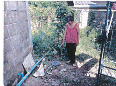
ลงพื้นที่ติดตามการจัดทำถังขยะเปียกลดโลกร้อน ในพื้นที่บ้านสันติสุข หมู่ 9 /บ้านทุ่งป่าชา หมู่6/บ้านข้าวตาด หมู่ 7 บ้านท่าต้นหาด หมู่ 8 และศูนย์พัฒนาเด็กเล็กตำบลตำบลศรีถ้อย(5 มิถุนายน 2569)