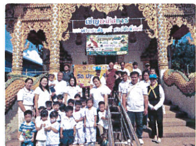
กิจกรรมโครงการวัด ประชา รัฐ สร้างสุข เพื่อเฉลิมพระเกียรติเนื่องในวันเฉลิมพระชนมพรรษา สมเด็จพระนางเจ้าสุทิดา พัชรสุธาพิมลลักษณ พระบรมราชินี(2 มิถุนายน 2569)