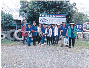
ลงพื้นที่สำรวจแหล่งเพาะพันธุ์และทำลายลูกน้ายลายในหมู่บ้าน ชุมชน เป็นประจำทุกสัปดาห์ เพื่อป้องกันโรคไข้เลือดออก โดยเน้นการปฏิบัติตามมาตรการหลัก 5 ป. 1 ข. และรายงานผลผ่านระบบดิจิทัล(7 มิถุนายน 2569)