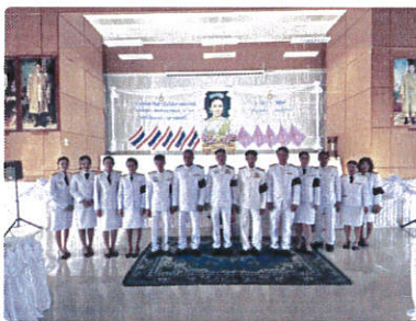
เทศบาลตำบลศรีถ้อย ร่วมพิธีเฉลิมพระเกียรติเนื่องในโอกาสพระราชพิธีมหามงคลเฉลิมพระชนมพรรษา 4 รอบ สมเด็จพระนางเจ้าฯ พระบรมราชินี ณ หอประชุมว่าการอำเภอแม่ใจ จังหวัดพะเยา(3 มิถุนายน 2569)