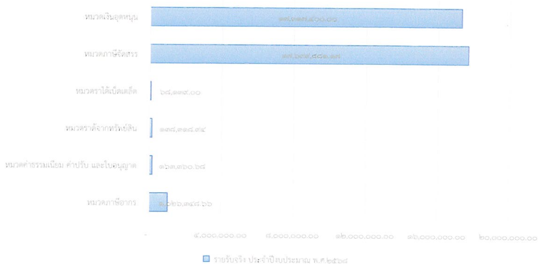
รายรับจริง ประจำปีงบประมาณ พ.ศ.๒๕๖๘

จะเห็นว่า กองคลัง เทศบาลตำบลศรีถ้อย ไม่พบปัญหาและอุปสรรคในการใช้จ่ายเงินงบประมาณ มีการควบคุมงบประมาณได้อย่างมีประสิทธิภาพ ไม่เกินงบประมาณที่ได้รับจริง และสามารถเบิกจ่ายในปีงบประมาณ พ.ศ. ๒๕๖๘ ได้ตามผลสัมฤทธิ์ตามเป้าหมายคิดเป็นร้อยละ ๙๓.๑๙ ของรายรับจริง และในการตั้งงบประมาณที่สูงเพื่อรองรับภารกิจตามอำนาจหน้าที่ รวมถึงการโอนเงินไปยังผู้สูงอายุที่คาดว่าจะได้รับจริงภายในปีงบประมาณ